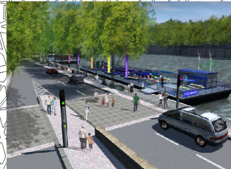
PORT DE L'HÔTEL DE VILLE