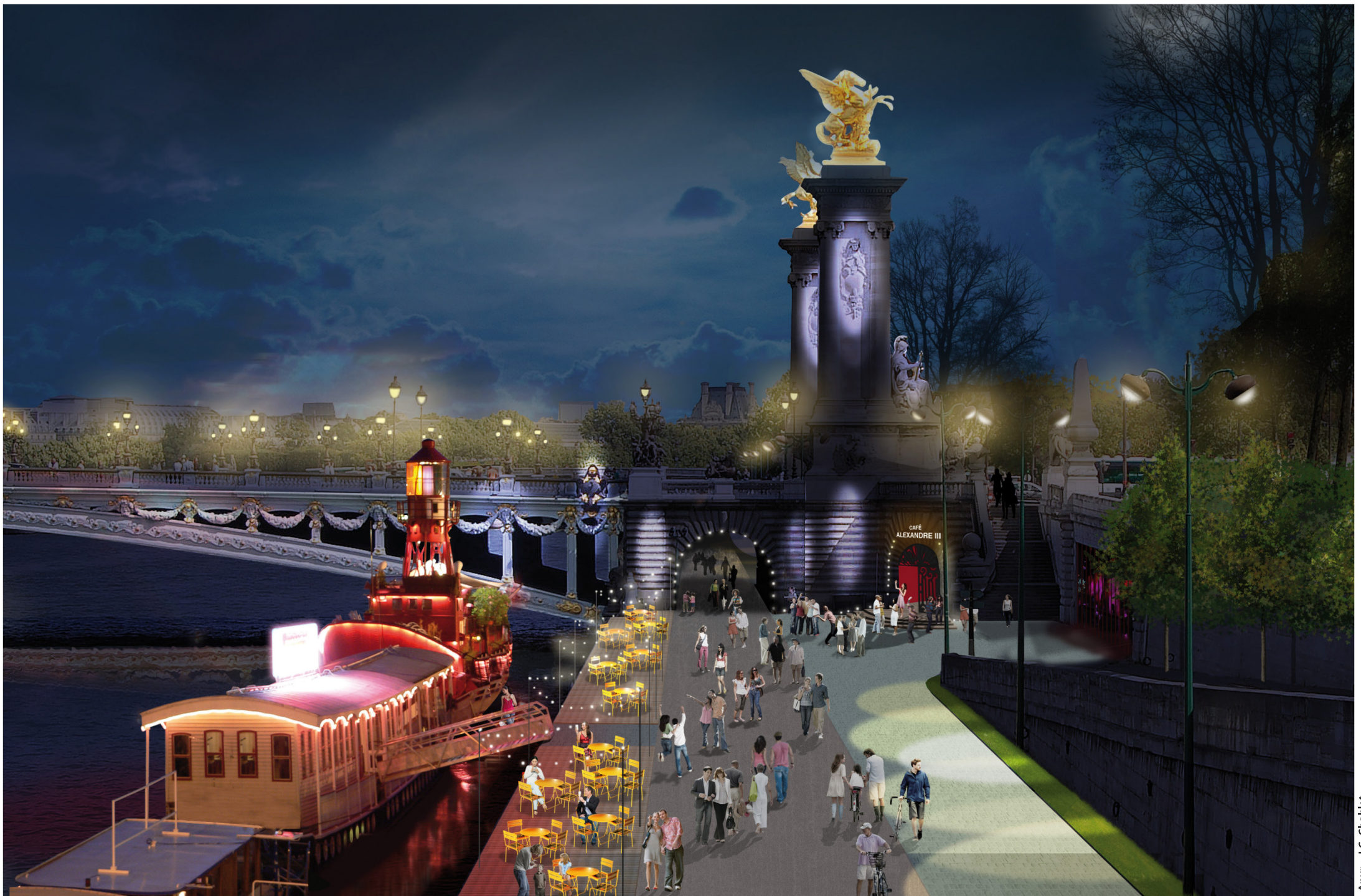
Pont Alexandre III