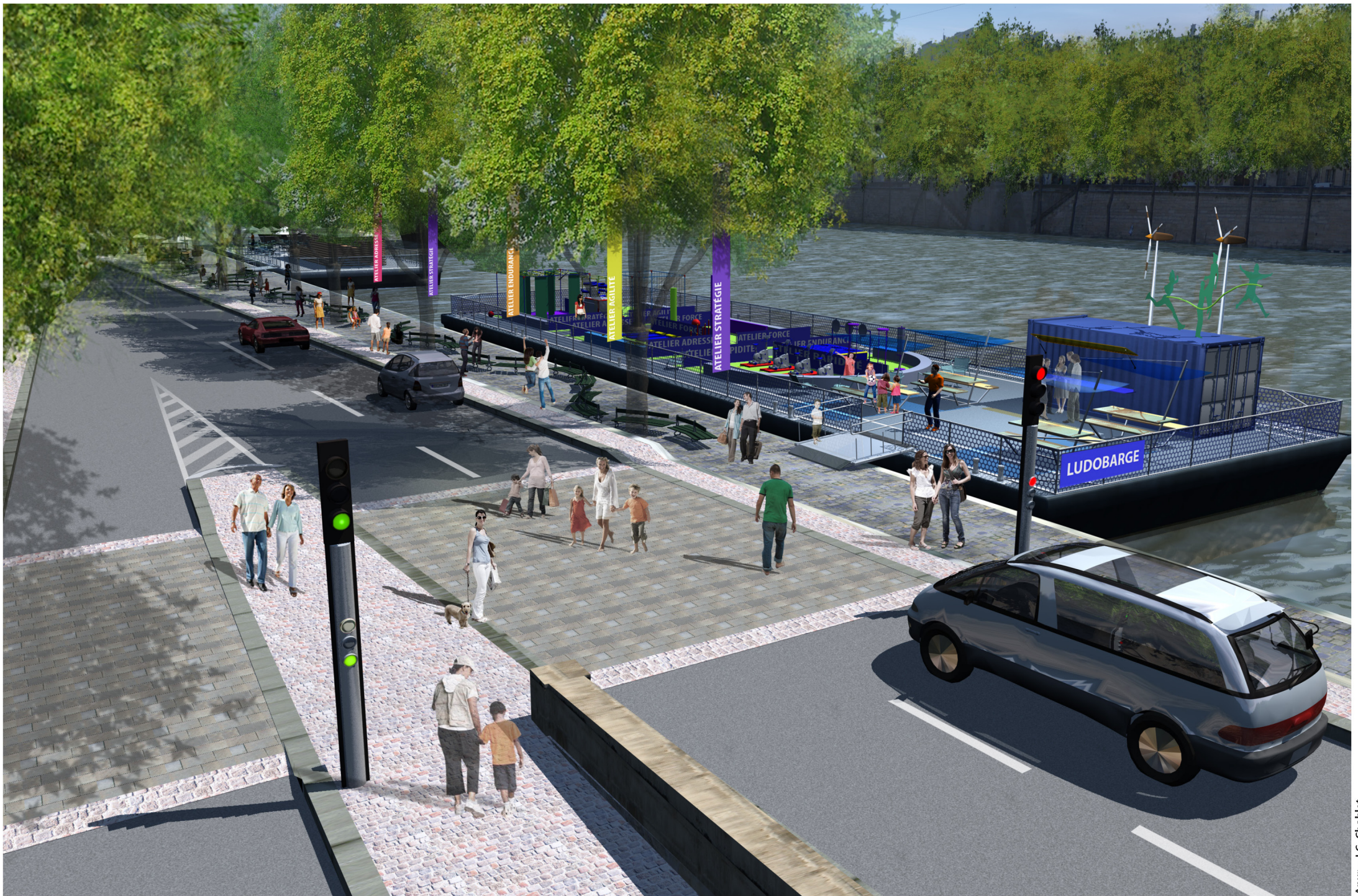
Port de l'Hôtel de Ville