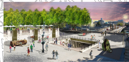
JARDIN DES TUILERIES MUSÉE D'ORSAY