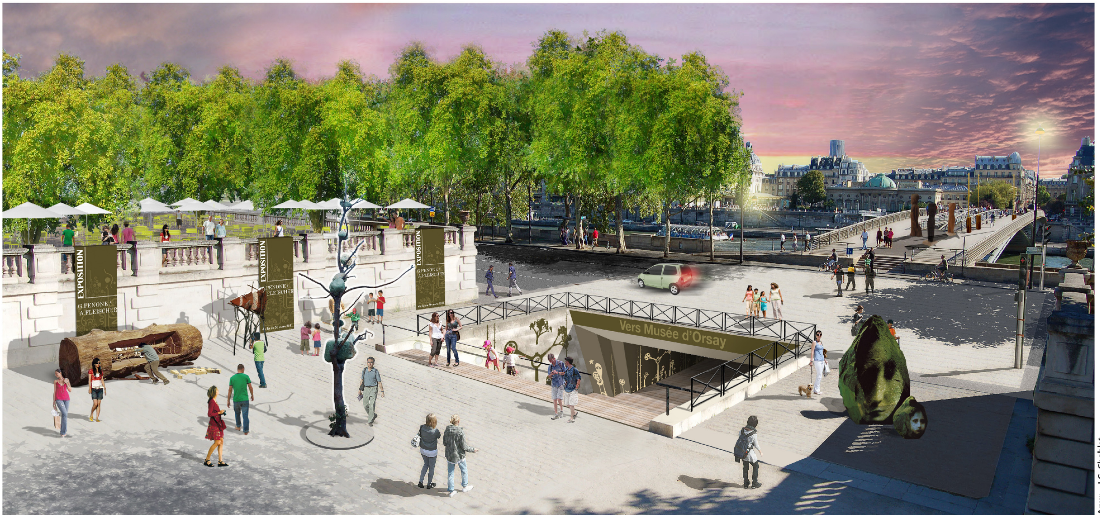
Liaison jardin des Tuileries – Musée d'Orsay