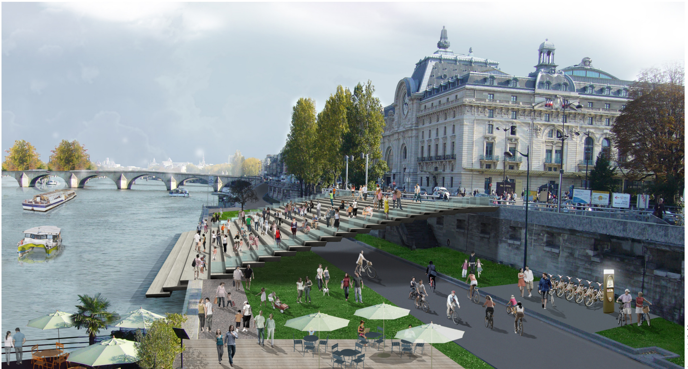
Port de Solférino – Musée d'Orsay