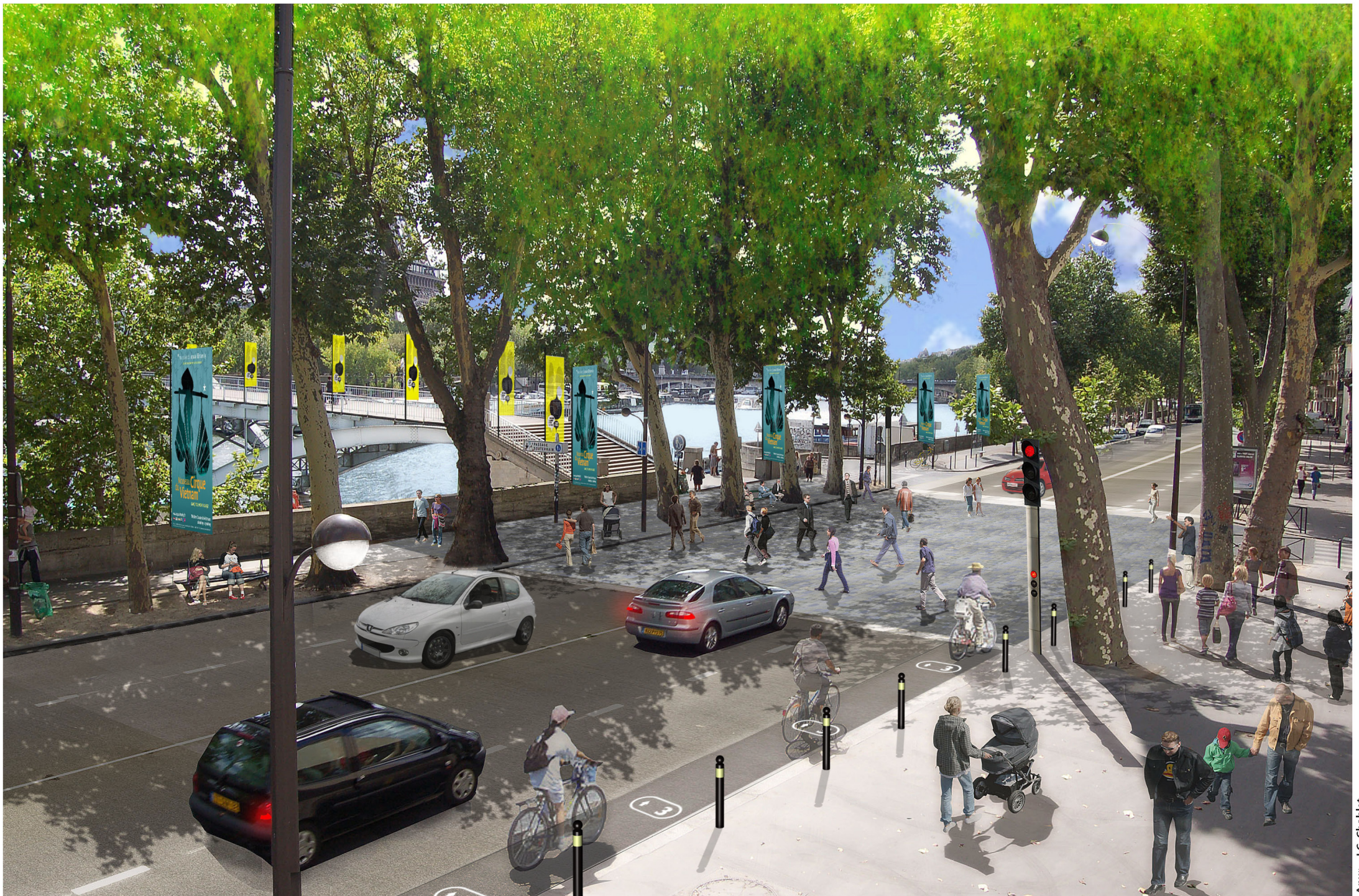
Passerelle Debilly – Palais de Tokyo – Musée du quai Branly