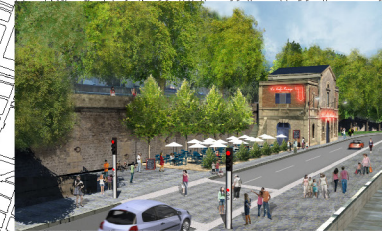
PORT DES CÉLESTINS