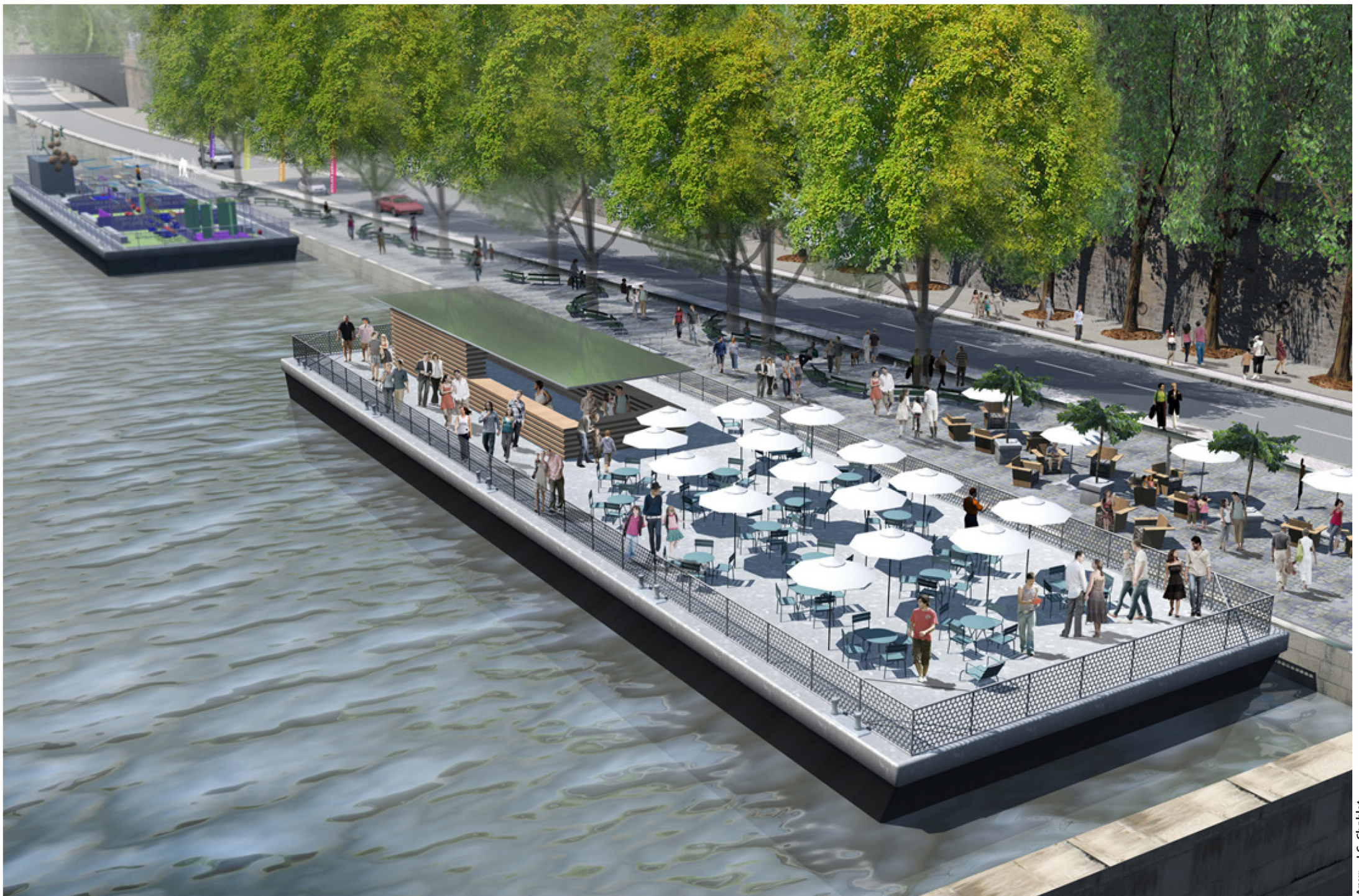
Port de l'Hôtel de Ville