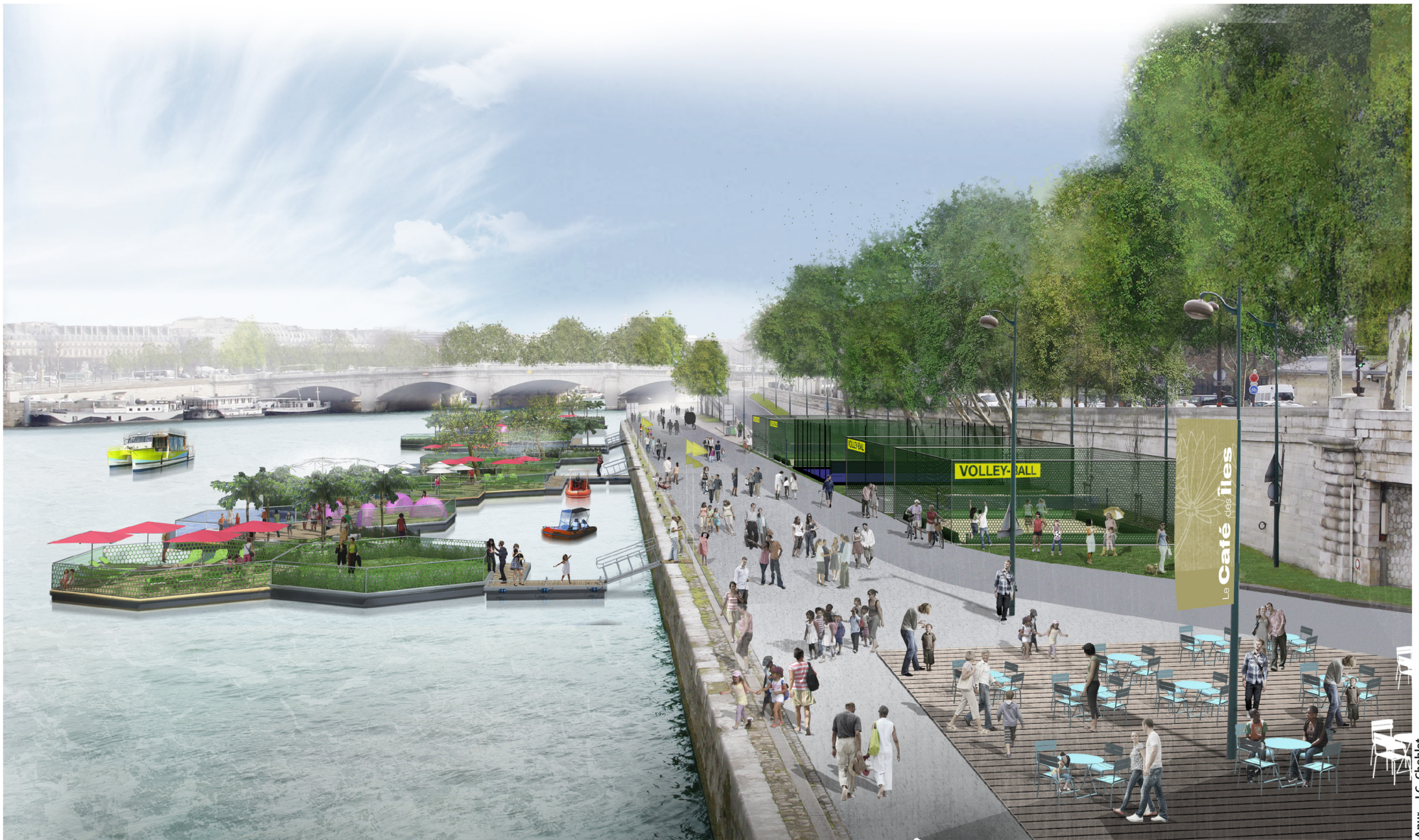
Port des Invalides-Concorde