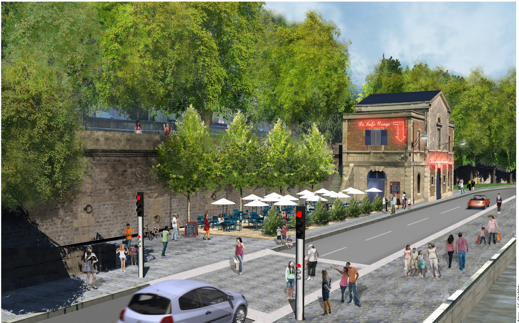
Port des Célestins