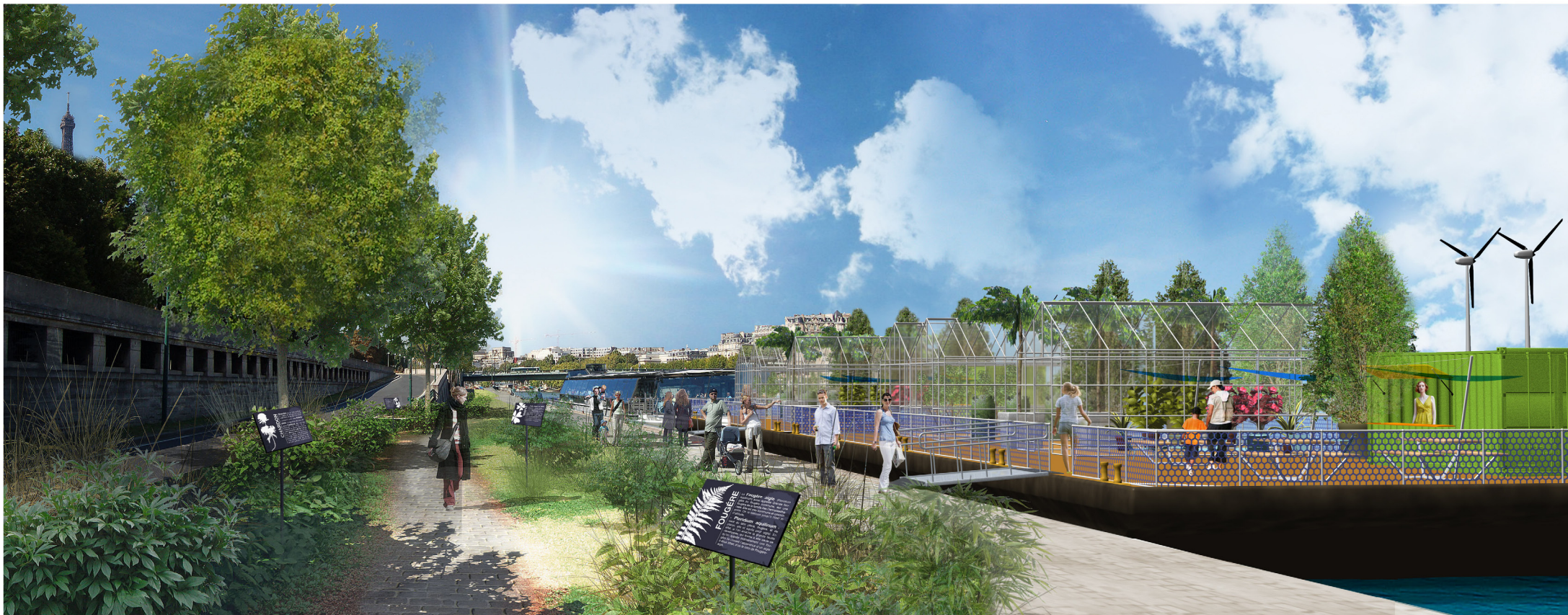
Pont de l'Alma