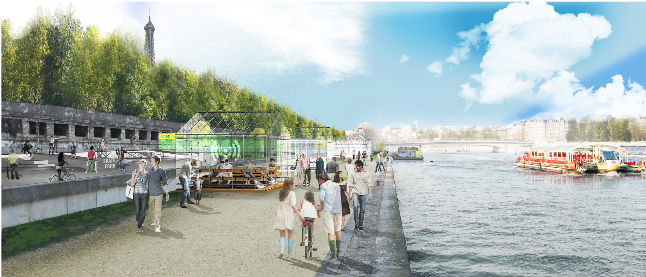
Port du Gros-Caillou