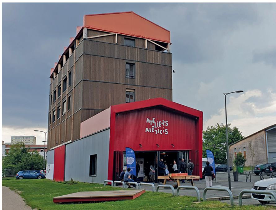
Les Ateliers Médicis, Lieu de recherche, de création et de partage situé à Clichy-sous-Bois et Montfermeil

Ainsi qualifiés, les lieux culturels ont été cartographiés avec le projet de Grand Paris Express à 3 échelles différentes : la Métropole, les lignes du futur métro, les quartiers de gare.